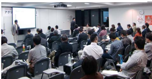
アグリビジネススクール 2013 会場の様子

企業の農業経営者としての基本的心構えや、経営者として必要な財務、人材育成、流通、生産管理、マーケティング等の知識習得のため年間24回の講座を実施。2013年度は3年目を迎える。