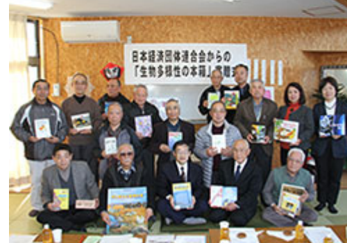
相馬市松川浦ふれあいサポートセンターでの「生物多様性の本箱」寄贈式(2015年1月)