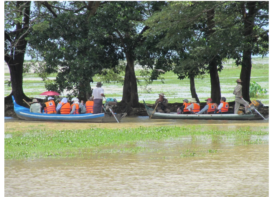
海外NGOの支援活動視察(2016年10月)