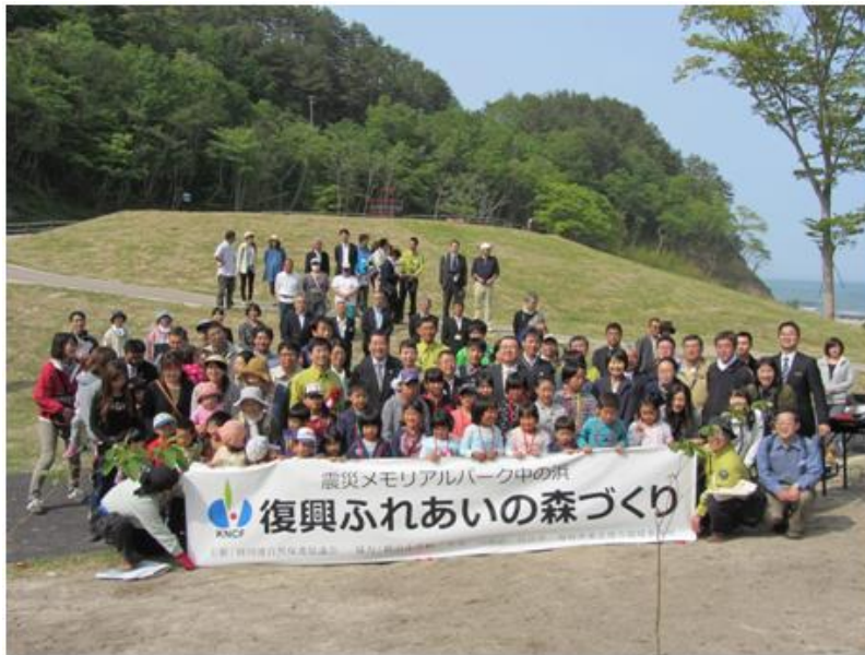
岩手県宮古市「震災メモリアルパーク中の浜」での植樹イベント(2014年5月)