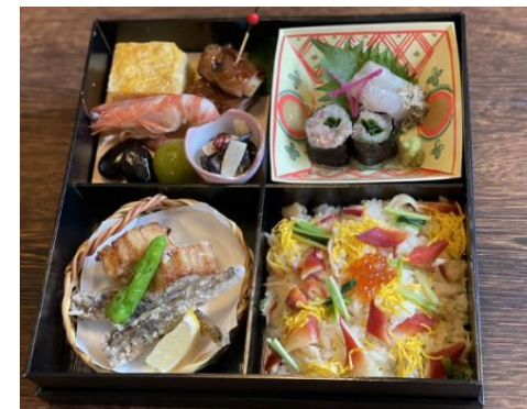
常磐もの穴子けんちん揚げ