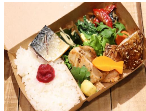
女川産のギンザケ塩焼き