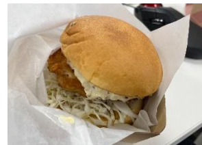
あんこうのフィッシュバーガー