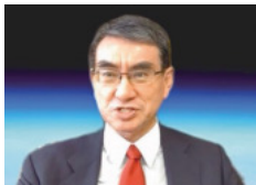
河野大臣（当時）への建議 2021年9月16日

実現することを求めている。 未来につながる規制改革の実現にスピード感をもって取り組むとの大変力強い発言があった。今年8月には夏野剛議長（慶應義塾大学大学院政策・メディア研究科特別招聘教授）のもと、規制改革推進会議の体制も新しくなり、既にワーキング・グループにおいて具体的な議論が進んでいる。 与党においても、櫻田義孝自民党行政改革推進本部長に提言の説明をしたところ、「どれも納得のいく要望であり、推進していく」旨の前向きな発言を得ることができた。 規制・制度改革には終わりが無い。行政改革推進委員会では、DXと技術革新を見据え、今後も必要な規制改革を提言していく。引き続き会員企業の皆様のご支援をお願いしたい。