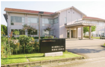
能力開発センター(職業能力開発校)

当社は、北陸軍需監理部の指導により北陸3県の主要な電気工事業者13社が統合して、1944年10月に設立された。設立以来、北陸地域における電気工事業者のリーダー企業として地域とともに歩み続け、東京・大阪にも営業基盤を設けるなど積極的に事業の拡大を図り、今日まで成長してきた。