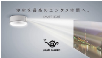
グループ会社popInが開発したスマートライト「popIn Aladdin」

百度のミッションである「テクノロジーで複雑な世界をもっとシンプルに」を掲げ、中国のAI技術を活用し、サービスを発展させることで中国と日本の懸け橋的存在としての使命を果たすとともに、日本の経済発展に寄与していきたい。