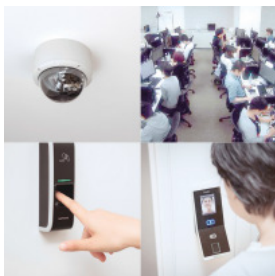
徹底したセキュリティーシステムで守られたテストセンター

また、事業運営において培ったノウハウを惜しみなく提供する教育サービス「ピンシツ大学」や、脆弱性検証、負荷テスト、ソフトウェア製品のUI(ユーザーインターフェース)、UX(ユーザーエクスペリエンス)を含む「使い心地」を検証するチューニングサービスやカスタマーサポートなど、SHIFTグループとして幅広いサービスラインナップをそろえている。