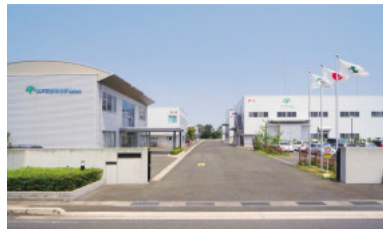
当社の製造拠点である出雲工場(鳥根県出雲市)

たことにより幅広い分野で研究・開発から生産まで、質の高いソリューションの提供を目指している。