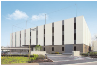
クラウドサービスの拠点「TKCインターネット・サービスセンター」

民法・行政法などの法律に深くかわりながら、高度な社会的責任を持つ税理士・公認会計士および地方公務員の業務遂行を、ICT(情報通信技術)を媒介として支援し、広く日本経済と地域社会の発展に寄与することである。そのために、これからも専門性を深め、イノベーションを重ねていく。