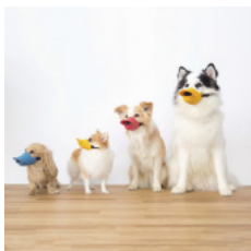
ペットと人が快適に共生する暮らし「OPPO」