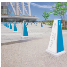
オリジナルデザインが1台からつくれる「ミセル」(東京スカイツリー設置例)