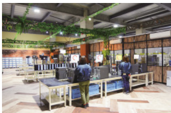
企業から回収した情報機器のデータを安全に消去するデータ消去室