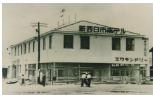
1957年創業「新四日市ホテル」

当社はチヨイスホテルズインターナショナル社(米国)が保有する世界的ホテルブランドの1つ「コンフォート」ブランド