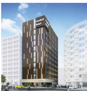
2019年11月1日オープン「コンフォートホテル名古屋新幹線口」

1957年、当社は三重県四日市市で駅前旅館として創業。その後「おもてなしと生活文化の創造」をスローガンに、確固たる経営理念と経営戦略に基づき、60年以上にわたりホテル専門オペレーターとして発展を続けてきた。2017年には東京証券取引所および名古屋証券取引所市場第二部に株式上場し、翌2018年には同市場第一部銘柄へ昇格を果たした。