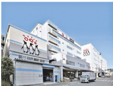
東大阪物流センター：全在庫を一括管理

あらゆる工業製品、建造物、社会インフラ とものづくりの現場で絶対に不可欠な「ねじ」。 無人島に行かなければ、半径3m以内に必ずある「ねじ」。当社は、そんなねじを中心としたファスニング関連製品を取り扱っている。「お客様の役に立ちたい」をモットーに、お客様が必要なときに、必要なところへ、必要なだけ、確実に届けることに全力で取り組み、品ぞろえ110万アイテムのねじを、最新のITとロジステイクスを