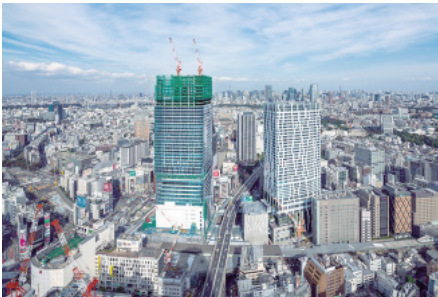
2019年竣工 渋谷スクランブルスクエア 第1期(東横)

なかにおいても、技術を磨き顧客の信頼を愚直に積み重ね、セルリアンタワー東急ホテルをはじめとする街のランドマークとなるような難工事を遂行した。 会社分割を経て、新生東急建設として「まちの価値創造に貢献していく企業」であることを宣言。これまでに培ったまちづくりのノウハウを渋谷駅周辺の再開発をはじめさまざまな地域で進化させ、まちの新たな価値創造へ活用している東急グループ唯一のゼネコンである。 激変する経営環境に対応すべく、当社のブランドメッセージ「Town Value-up Management」と企業ビジョン「Shinka(深化×進化)真価」し続けるゼネコン「東急建設」のもと、街づくりのパートナーとして常に新たな企業価値の創造に努めるとともに、時代が求めるサステナブルな社会づくりに向け貢献していく所存である。