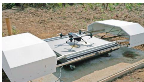
完全自動運用型ドローンシステム「SENSYN Drone Hub」

と捉え、点検業務全体の自動化を実現するソリューションを目指し、それらを社会実装していくことで、インフラ保全業務の安全化・効率化に寄与していく。