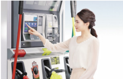
当社のガソリンスタンドのセルフシステム

当社の創業はコンピューター黎明期の1967年、誰もが簡単に使うことができる「人々にやさしいコンピューター」を開発し、人々を単純作業から解放しようという想いのもとスタートした。1971年に世界初のガソリンスタンド専用コンピューターを開発、販売して以来、石油業界のお客様を中心に、POS、クレジット決済、現金ソリューション、防犯システムやペーパードカードシステムのセルフシステム等の設計から、開発、製造、販売、保守までを一貫して行い、さらにコインパーキング、洗車、コインランドリー等のソリューションも展開している。 全国32拠点を設け、その地域のお客様の様々なニーズを把握し、製品