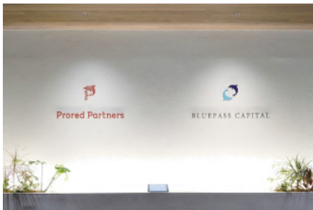
本社エントランス(東京都港区)

当社の最大の特徴は、国内で唯一、完全成果報酬型コンサルティングを提供していることである。2009年の創業以来、「価値＝対価」をビジョンに、価値あるものが適正に対価を得られる社会の実現を目指してきた。クライアントは、PEファンドやメーカー、自治体や銀行など多業種にわたり、上場企業をはじめとする大手企業から中堅中小企業まで幅広いのも特徴である。提供するサービスの主軸はコストマネジメントであり、50費目以上に対応する100名以上の専門コンサルタントが在籍している。これまでに培った独自のノウハウとデータをもとに、企業コストの削減コンサルティングを実施している。今まで1千社以上の企業にコスト削減サービスを提供してきた。