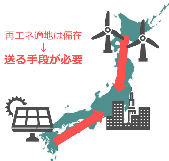
図表3 再エネ拡大に対応する送配電網整備が不十分