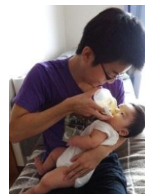
男性の育休取得100%達成