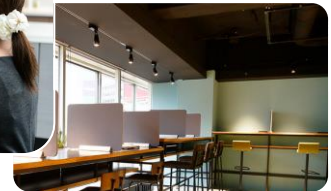
サテライトオフィス