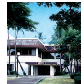
JAIS (ホノルル市 ハワイカイ)

○JAIS (日米経営科学研究所) 30周年記念基金 (2001年～2005年)