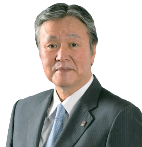
公益社団法人 企業市民協議会（CBCC）会長 Chairman Council for Better Corporate Citizenship (CBCC)

I look forward to your participation in CBCC activities.