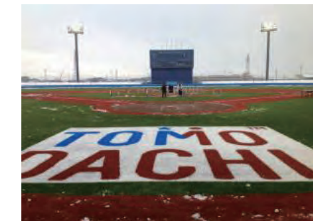
宮城県石巻市民球場のリニューアル・オープニング (2012年12月9日)