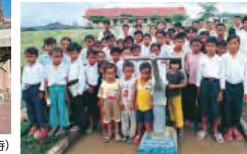
ポンプの土台に「日本の国際ボランティア野金の援助によって作られた」と記された井戸

○カンボジアにおける学校建設 および設備拡充プロジェクト (2004年～2012年)