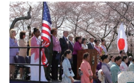
桜祭り「日本灯籠火入れ式典」 (2012年4月7日)