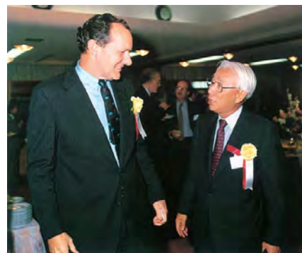
海外事業活動関連協議会設立総会レセプションにおける盛田会長とアマコスト駐日米国大使(いずれも当時)

対米投資関連協議会を設立 Council for Better Investment in the United States (CBIUS) was established.