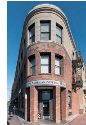
全米日系人博物館の本館 (旧西本願寺)

○カンボジアにおける学校建設 および設備拡充プロジェクト (2004年～2012年)