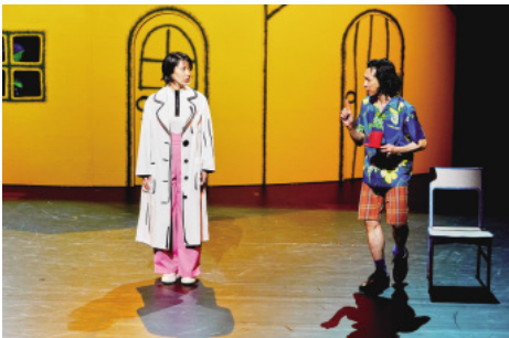
2019/2020 シーズン演劇「イヌビト～犬～」 撮影：細野晋司