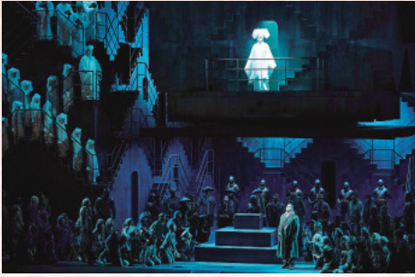
2018/2019 シーズンオペラ「トゥーランドット」