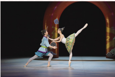
世界初演・新作公演「竜宮りゅうぐう」こどものためのバレエ劇場 2020