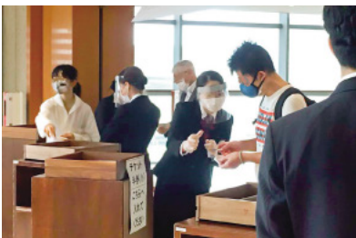
安心・安全に最大限留意した新国立劇場の対策： 公演時のオペラパレス入口（2020年7月）