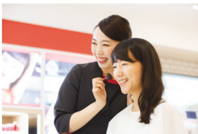
美しく、笑顔で輝くお客さまを増やしたい

「私たちは、多くの人々との出会いを通じて、新しく深みのある価値を発見し、美しい生活を創造します」。これは資生堂グループの企業理念である。当社は、世界中の人々の「美への思い」を真摯に受け止め、美しい生活文化を創造し続けることを使命とし、