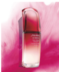
革新の美容液。アルティミューン