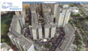
シンガポール政府と共同で進める、3Dを使った都市計画

産業・あらゆる段階で同時多発的に起こっており、製品開発や事業開発には、現場から意思決定者まで、時には社外のリソースや消費者まで巻き込む仕掛けが必須となる。こうしたなか、当社は3DEXPERIENCEプラットフォームとソフトウェア群を提供し、専門領域や地域の垣根を超えて、人と人、情報と情報をつなぐイノベーションを後押ししている。