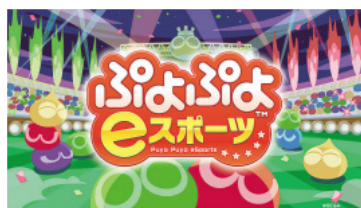
ぶよぶよeスポーツ

当社は、2004年にゲームメーカーのセガと、遊技機メーカーのサミーが経営統合して誕生し、現在では国内外に60社を超える日本発のエンターテインメント企業グループである。ゲームコンテンツ、アミューズメント施設、トイ、映像制作等を手がけるエンターテインメントコンテンツ事業や遊技機事業では、常に先進的な製品・サービスの創造に取り組む、数多くのヒットを生み出してきた。 また、今後のさらなる成長を目指し、宮崎に所在する「フェニックス・シーガイア・リゾート」や、韓国初の統合型リゾート「パラダイスシティ」の開発、運営を手がけるリゾート事業の育成にも注力し、エンターテインメントビジネスのフィールドを広げている。 当社は、エンターテインメントの領域にお