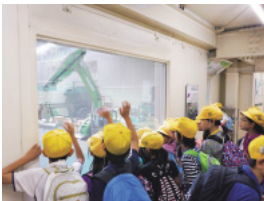
体験型環境教育の様子

10」を開発し、全国初・産業廃棄物由来の商品で建設技術審査証明を取得。無駄にしないエネルギーをコンセプトに産学官で連携し、振動発電、集塵機の排風を利用した発電、AI・IoT技術を活用した選別ロボットなどの研究開発に取り組んでいる。 こうした主たる「資源循環事業」とともに、「体験型」サステナブルフィールド「三富今昔村」の運営にも携わり、環境教育等促進法に基づく「体験の機会」として認定を受け、毎年小学生から大学生まで約5000名を対象に授業を行っている。 2017年には「体験の機会」研究機構を設立し、環境省との協定を締結した。国内外や地域の交流拠点として建設した「くぬぎの森交流プラザ」は、「人と自然と技術」のつながりの場として、昨年度は年間約4万人の人々が訪れている。 当社は産業廃棄物処理事業から、「エネルギー供給循環産業」へと生まれ変わるため、日本における環境教育の情報発信基地となるべく新たな挑戦をし続けていく。