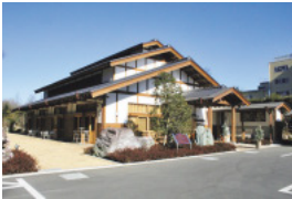
国内外や地域の交流拠点「くぬぎの森交流プラザ」