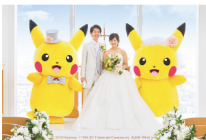
大人気！ポケémonスターブライダルフェア

当社はブライダル業界初のコールセンターの設置、システム構築による顧客の一元管理、結婚式にかかわるコンテンツの内製化による