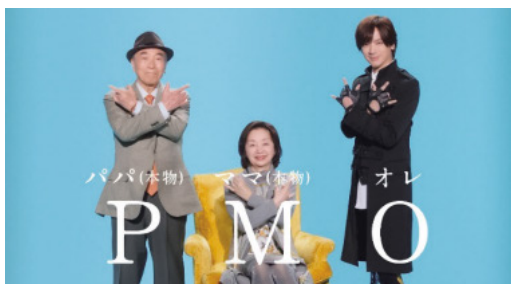
2020年3月から放映したTVCM DAIGOさん出演「PMOってなんなんだ?」パバママ共演編

「マネジメントの力で社会のハピネスに貢献する」ことをミッションとして掲げ、創業以来プロジェクトマネジメントの実行支援を主力事業としている。マネジメントソリューションズ(略称MSOL:エムソル)は、昨年(2