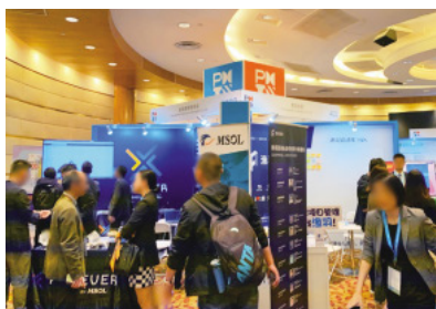
PMI China Congress 2019 出展ブース