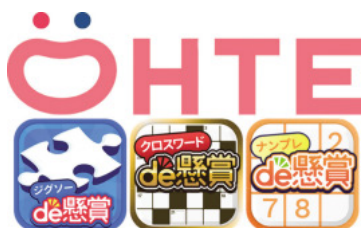
オーテ社が提供するスマートフォンアプリロゴ

2019年にスマートフォン向けカジュアルゲームアプリを運営するオーテ社をグループに加え、高度で安心して喜んでもらえるサービスの創造・提供を行い、モバイル広告に改革を起こしたいという思いから、広告主とメディア(媒体)を繋げるアドネットワーク事業会社として2007年に創業した。その後、2014年に寄付者と自治体の返礼品や支援を紹介するふるさと納税ポータルサイト「ふるなび」の運営を行うふるさと納税事業に加え、2016年にマザーズへ上場した後、2018年には東京証券取引所市場第一部へ市場変更を行った。