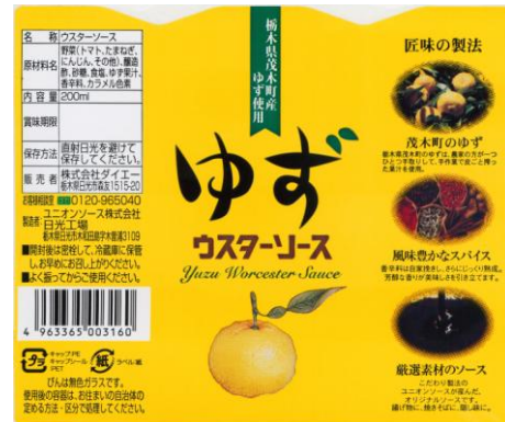
「ゆずソース」パッケージにて「茂木町のゆず」をアピール

株式会社足利銀行では、地元認知度の向上ニーズがあるユニオンソース(株)(東京本社・栃木県内にてソース製造)と、「ゆず」を使った新たな特産品を開発し地域の活性化に繋げたい茂木町の両ニーズをマッチングし、企画・販売・パッケージング・プレス発表に至るまで紹介・アドバイスを実施、2010年8月10日に「道の駅もてぎ」にて新商品「ゆずソース」の発売開始となった。当初製造した4,000本の商品も順調な売れ行きで推移し、近隣観光地やホテルからも土産用特産品、業務用として問い合わせが来ている。