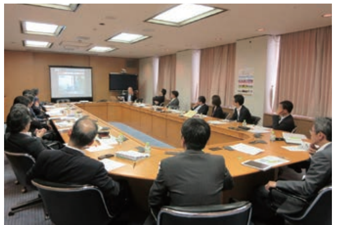
グループ企業のトップが集まりSDGs研修を実施

特にSDGsは、社会的課題に関する世界の共通言語となっているため、それを用いて多様なステークホルダーと連携することは、自社のイノベーションや市場創造の機会の増大にもつながる。