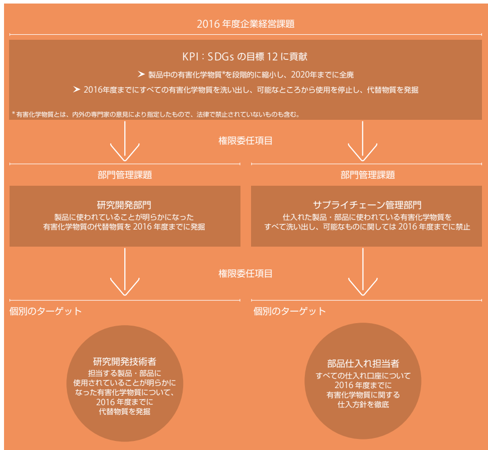
SDGsの社内への周知徹底に向けた具体例