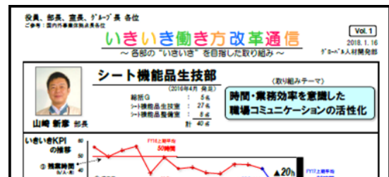
5) いきいき通信(社内イントラに掲載)