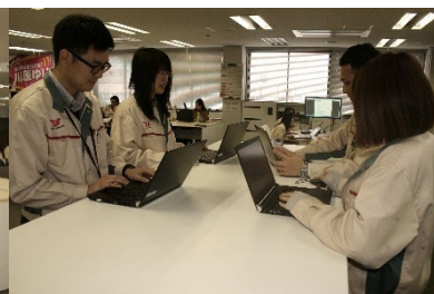
モバイル PC によるペーパーレスミーティング