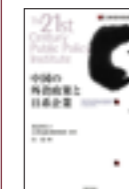
21世紀政策研究所叢書