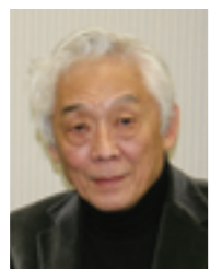
青木昌彦 スタンフォード大学名誉教授