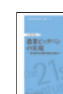
21世紀政策研究所新書