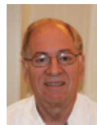
ジェラルド・カーティス コロンビア大学教授