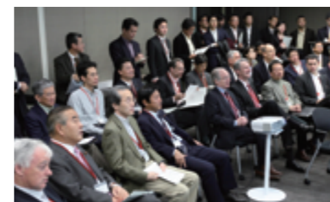
シミュレーション参加者たち

2009年11月、内外の有識者、経済界関係者など約50名が参加して、主要国の政治・経済のリーダーに扮し、金融危機後の世界において安全保障面の変化や環境・エネルギーの重要性の高まりが国際関係に与える影響を検証しました。