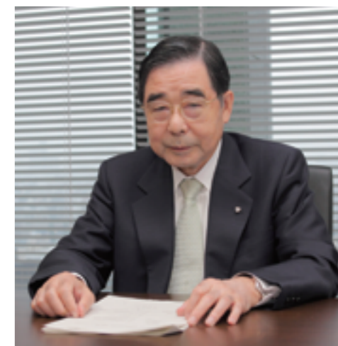
21世紀政策研究所 理事長

当研究所では、この3年間で延べ237名、8機関の参加を得て、税財政・社会保障から行革、環境、外交まで広範な研究領域にわたり、26の提言を取りまとめ、広く発信してまいりました。今後も、経団連の政策提言に役立つ研究活動を進めるとともに、研究から得られたさまざまな改革の視点やアイデアを政策として積極的に発信していくという21世紀研の使命を果たすべく、より一層努力してまいります。よろしくお願いたします。