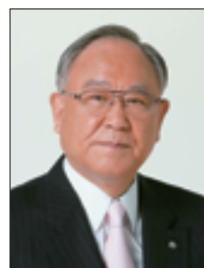
会長 御手洗富士夫